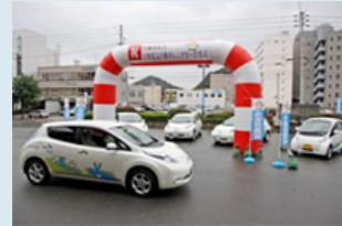
EVレンタカー出発式

平日は各市が公用車として使用している電気自動車を、土日・休日に市民や観光客に貸し出す事業を行政と協働で行い、環境に優しい自動車の有効活用や普及・啓発に努めています。